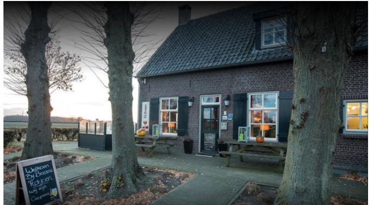
Brasserie Robben Molenhoefstraat 44 5071 RM Udenhout

..... Op 'n zomeravond bridgen in de vroegere paardenstal van Boer Robben was een hele belevenis. Het was geen bridgelocatie bij uitstek, maar wat geeft dat nu. Het was er, misschien mede daarom, huislijk en gezellig. Soms moest er een bouwlamp aan te pas komen om wat bij te lichten. Het licht is zelfs eens uitgevallen, maar dankzij de huidige, moderne, aardlekschakelaars, was dit euvel zo verholpen.